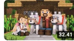
Wolf Life Full Animation - Minecraft Animation Alien Being ✓ 16 milj. katselukertaa • 5 vuotta...