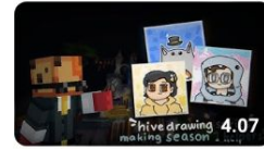
How Did I Draw 28 Helpers In A Week? | Hive Drawing Series - ... KervylsNubb 98 katselukertaa • 2 päivää sitten Uusi