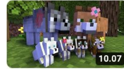
WOLF LIFE MOVIE | Green Cubes Minecraft Animations [...] GreenCubesYT 1,1 milj. katselukertaa • 1 vuosi...