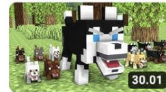
Monster School : Poor Zombie Dog Life ( Bad Family ) - Sad... LOR Minecraft Animation ✓ 342 t. katselukertaa • 1 kuukausi...