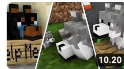
WOLF LIFE SEASON 2 | Cubic Minecraft Animations | All... Cubic Animations ✓ 6,4 milj. katselukertaa • 2 vuotta...